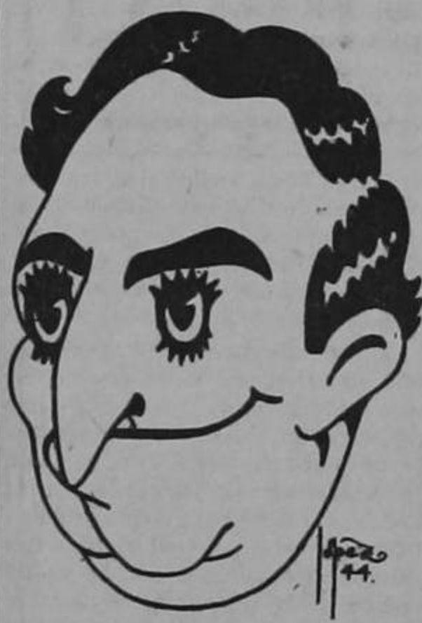
CALDERON A LA HORA DE PROMETER