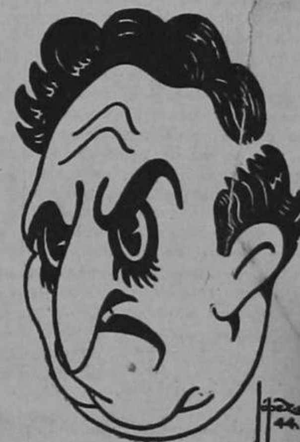
CALDERON A LA HORA DE CUMPLIR SUS PROMESAS